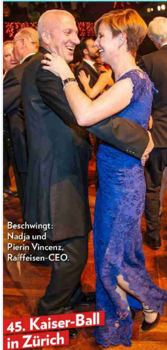
Beschwingt: Nadja und Pierin Vincenz, Raiffeisen-CEO.